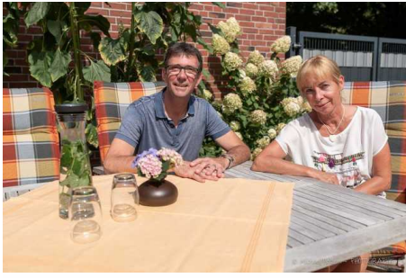
Objekt ID: 81695